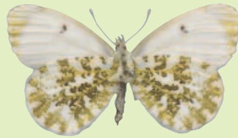
Ansicht von unten